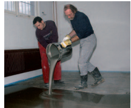
Rationeller und wirtschaftlicher Bodenausgleich mit PCI Periplan vor dem Verlegen von Oberbelägen.