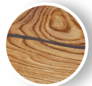
Kopf- und Flächenrisse