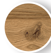
Äste fest verwachsen