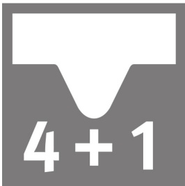
4+1 Woodvision Fase